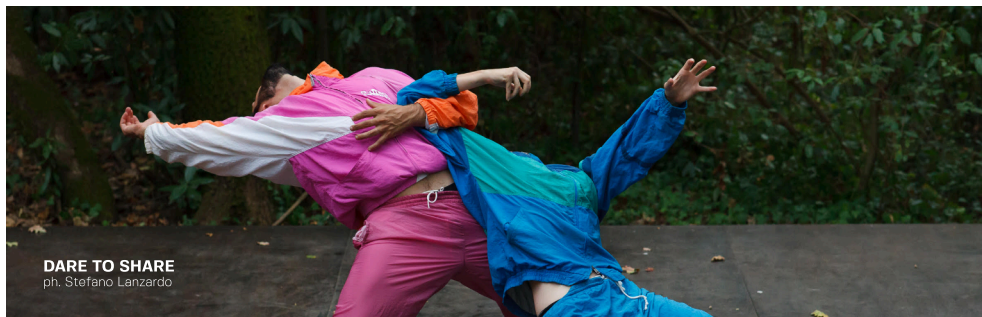
DARE TO SHARE

DADA Love è un duetto che attraversa l'universo dadaista come una danza di corteggiamento silenziosa e ironica. Pudore, attrazione e meraviglia guidano un linguaggio fisico essenziale, che conduce a un'intimità sospesa e poetica.