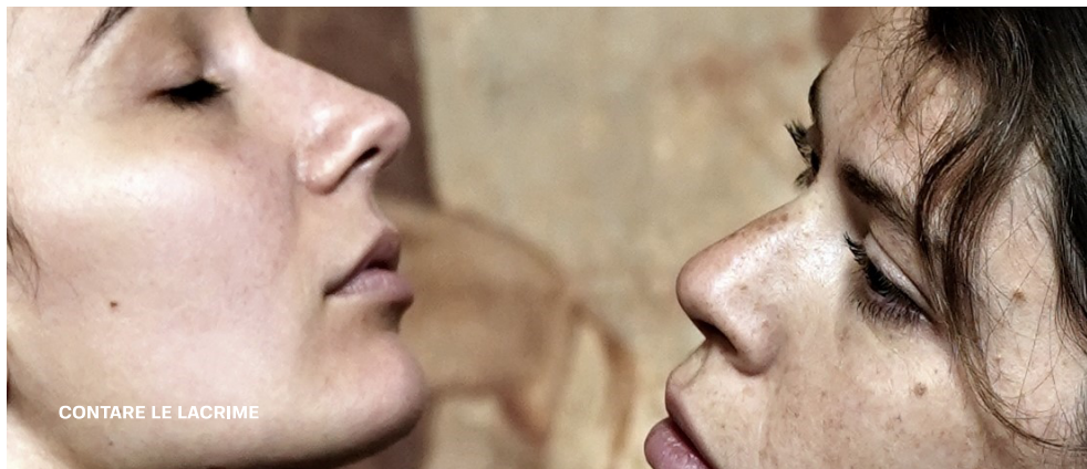
CONTARE LE LACRIME